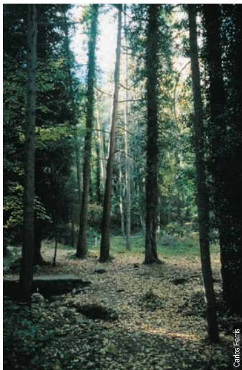
Fuente de la Pegunta, Vistabella del Maestrat

comarca: L'Alcalatén recorrido: 12 km tiempo: 3 h 15' difficultad: alta cartografía: 1:50000 Villahermosa del Río 592 (29-23) entidad promotora: Centro Excursionista de Castellón