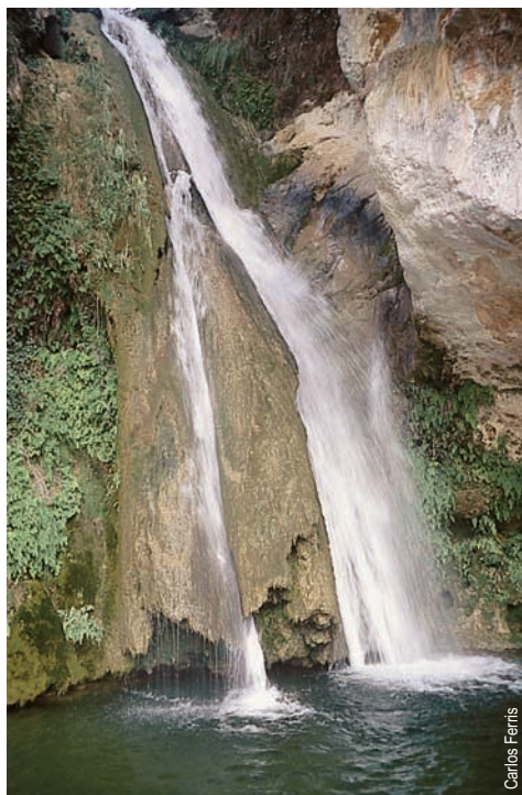
Cascada del Carbo

entidad promotora: Centro Excursionista de Castellón