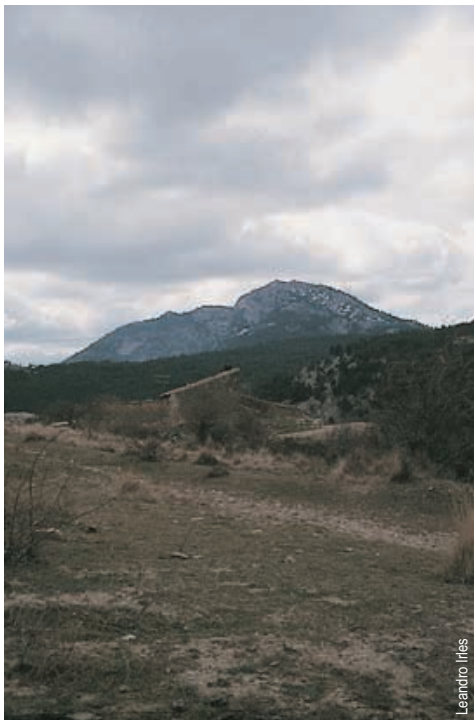
Mas de Mor, cima de Penyagolosa al fondo

entidad promotora: Centro Excursionista de Castellón