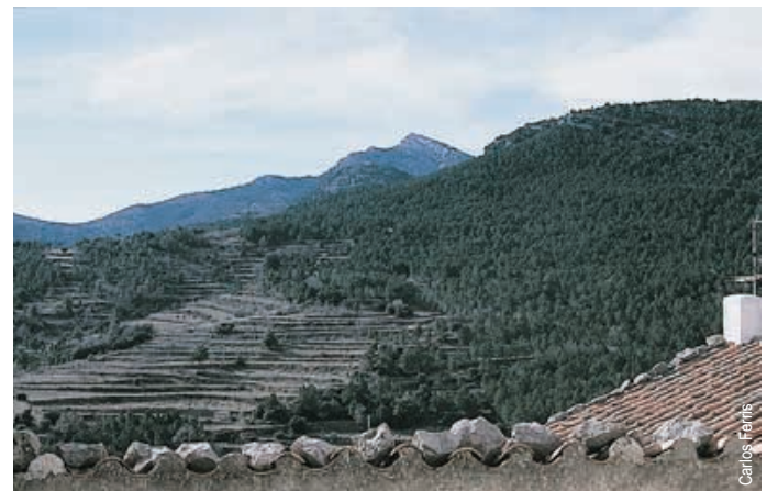
vista de Penyagolosa desde Xodos