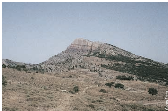
Cima de Penyagolosa